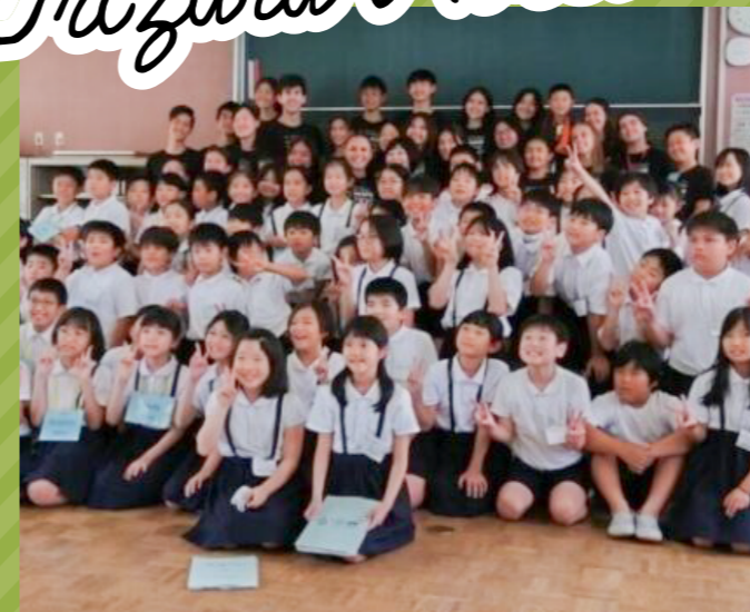
日本 広島 「幟町小学校とハワイの子どもたち」