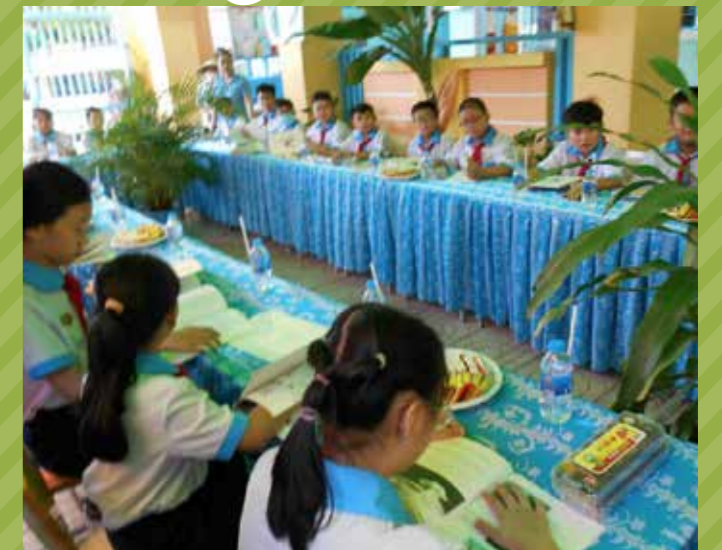
ベトナム 「ベトナム友の会」